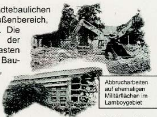
Abbrucharbeiten auf ehemaligen Militärfächen im Lamboygebiet

Das Schwergewicht der städtebaulichen Entwicklung soll nicht im Außenbereich, sondern im Innenbereich liegen. Die weitreichenden Möglichkeiten der Innenentwicklung Hanaus entlasten den Außenbereich von neuen Bauvorhaben und bieten die Chance, Fehlentwicklungen und ökologische Belastungen im Innenstadtbereich abzubauen.